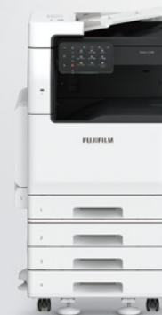
コンセプト(複合機)