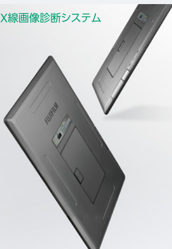
X線画像診断システム